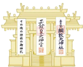
三社造りの神棚の場合